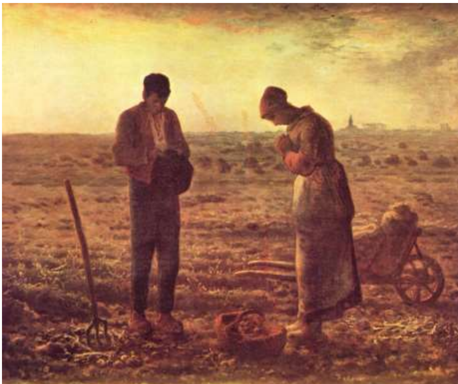
« L'Angélus », tableau de J-F Millet